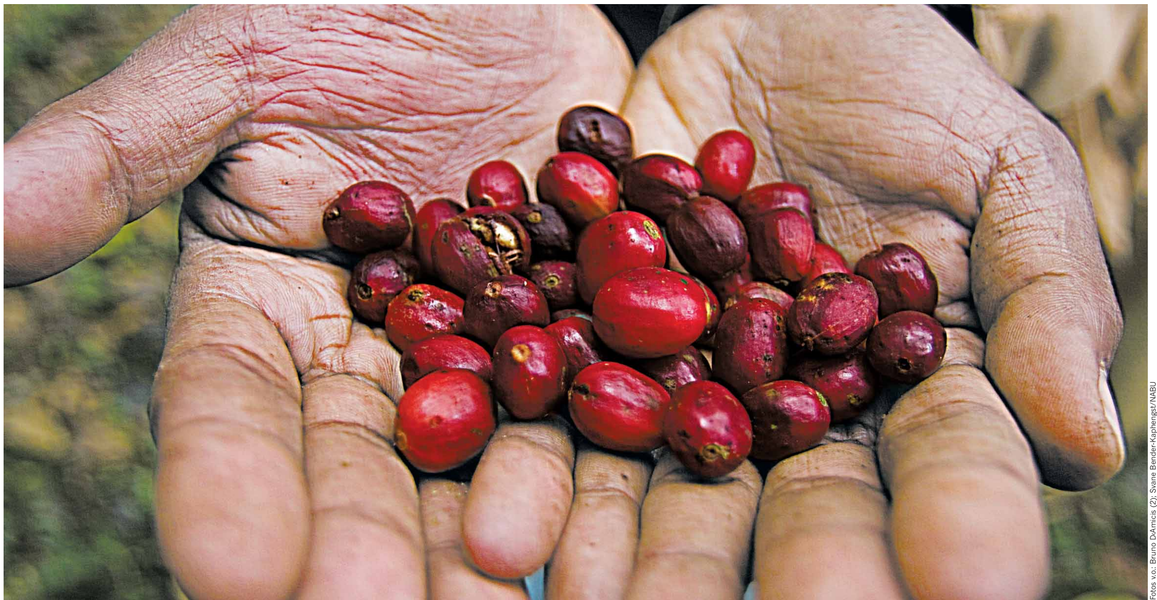
LEUCHTEND ROT sind die wilden Arabica-Bohnen im Wald von Kaffa