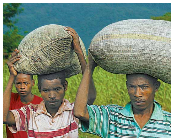
KAFFEETRÄGER auf dem Weg ins Dorf