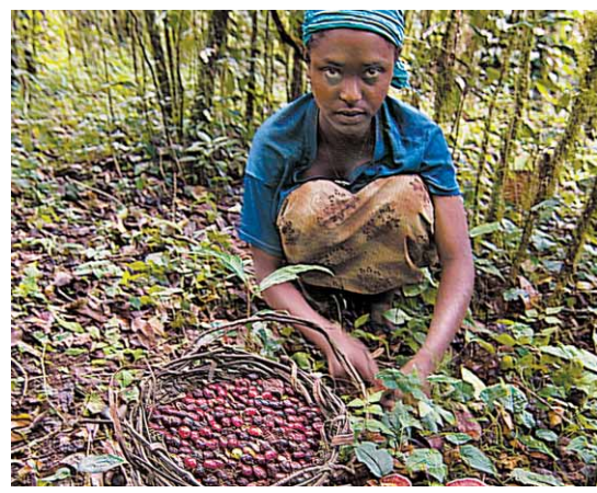
BOHNENLESE nach dem Regen